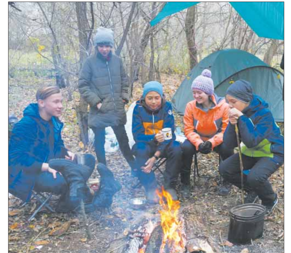
На привалах кадеты ставили палатки и разжигали костры