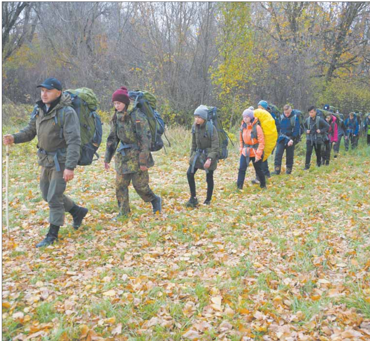
В день ребята с преподавателями проходили около 10 километров.