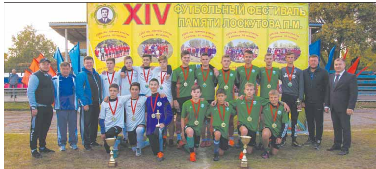
Фото на память с богучарскими призерами и организаторами турнира

Воспитанники спортивной школы завоевали два призовых места