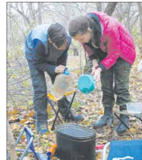
Каждый день были дежурные по кухне

Рацион питания столичных гостей в нашем районе был прост. Они готовили на костре каши, супы, чай. Все продукты, кстати, привезли с собой, посуду – тоже.